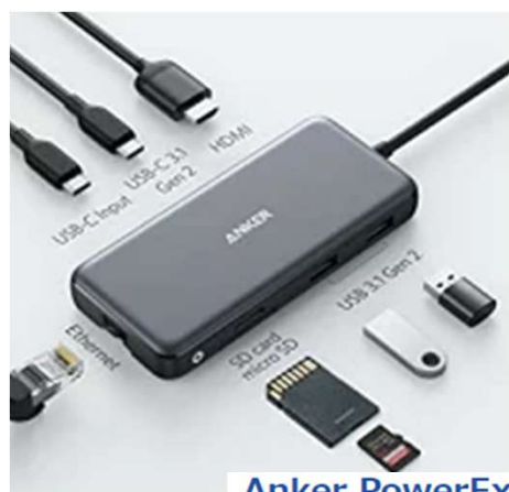
Anker PowerExpand 8-in-1 USB-C PD 10Gbps データ ハブ 100W出力 USB Power Delivery 対応 USB-Cポート 4K出力対応 HDMIポート 10Gb

SanDisk SSD 外付け 500GB USB3.2Gen2 読出最大 1050MB/秒 防滴防塵 SDSSDE61-500G-GH25 エクス トリーム ポータブルSSD V2 Win Mac PS4 PS5