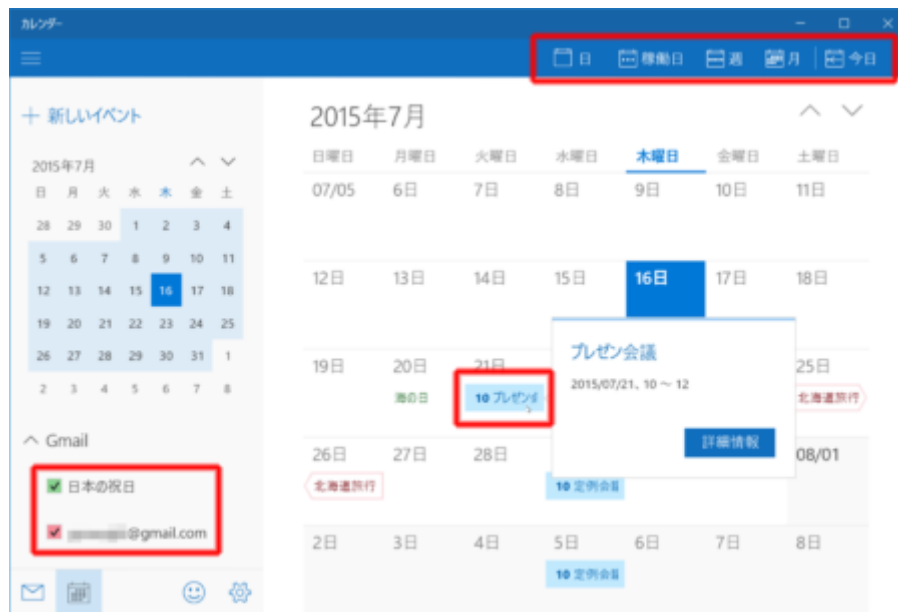
図 6 ●スケジュール管理に便利なのが「カレンダー」アプリだ。入力した予定が、カレンダー上に表示される

予定の管理に便利なのが「カレンダー」アプリだ（図 6～図 8）。カレンダーアプリは、マイクロソフトや Google のカレンダーサービスを登録して、自分のカレンダー上に表示したり、編集したりできる。