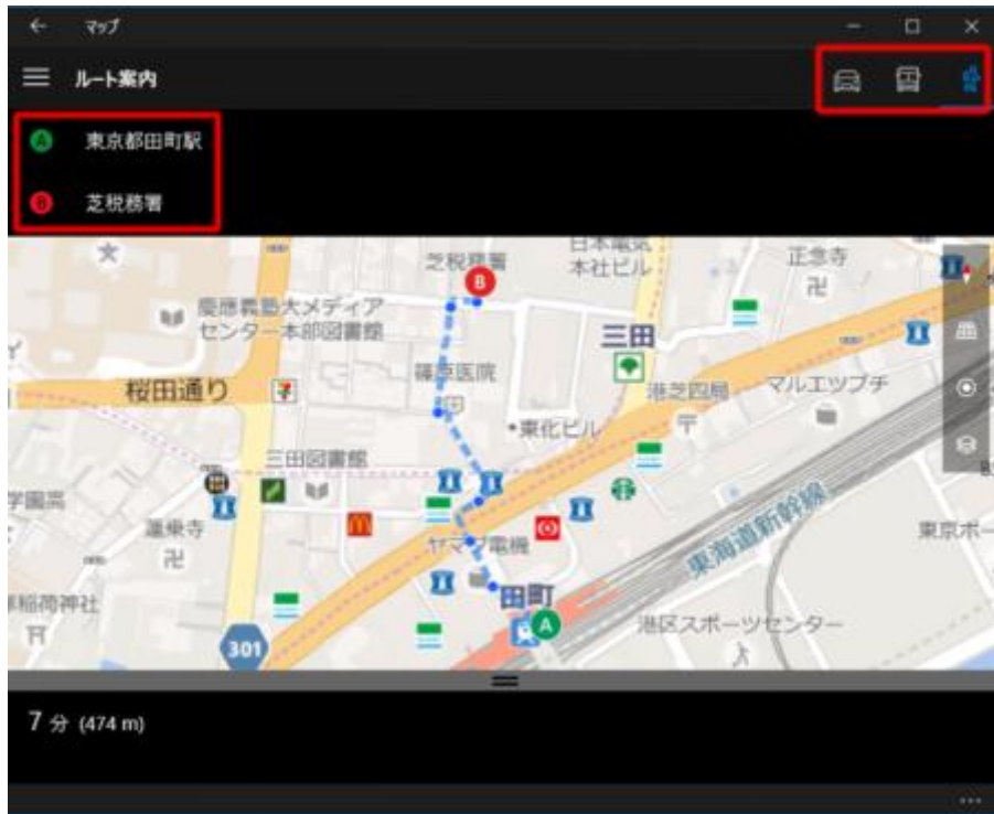
図 10 ● 経路検索も可能だ。出発地点と到着地点、交通手段（車、公共交通機関、徒歩）を選んで実行すると、地図上に経路が示される。下の詳細情報を表示すると、詳しい案内が表示される