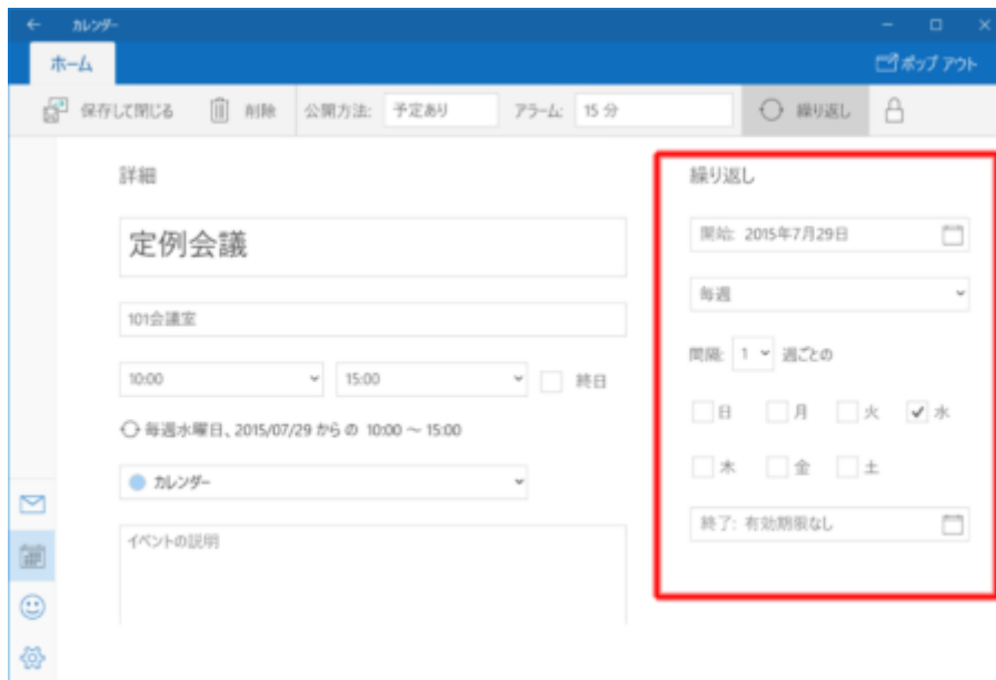
図 8●図 7で「詳細情報」を選ぶと、細かく設定できる。 繰り返しの予定の設定や、通知のタイミングなどを指定可能だ

地図を表示する「マップ」アプリも便利だ（図 9、図 10）。検索した地点の地図を表示するのはもちろん、2点を指定した経路検索や、スポットの関連情報、道路の混雑状況、衛星写真の表示など、多くの機能を搭載している。